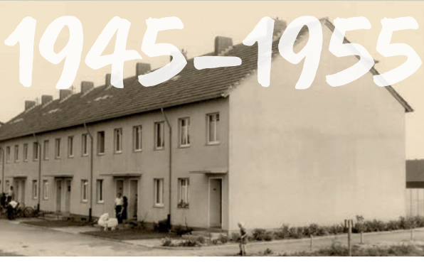
Wieskirchenstraße 24-40, Hackenbroich, erbaut 1953

Die ersten Nachkriegsjahre Wiederaufbau ist Hoffnung. Wohnraum wird zur Existenzfrage.