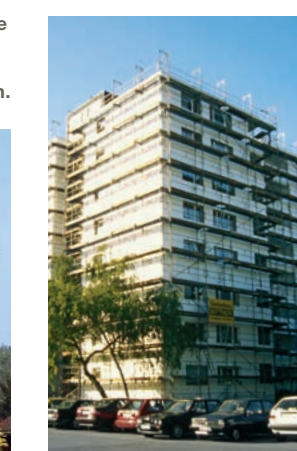
Sommer 1985: Modernisierung im Eichenweg 7