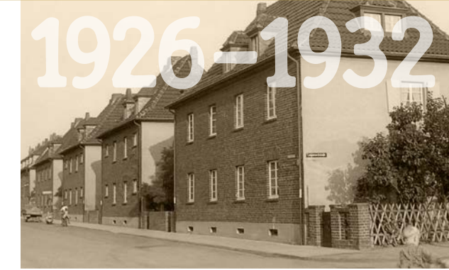
Helmbüchelstraße 2-24, erbaut 1927

Gründung der Genossenschaft Der Mut, gemeinsam zu bauen. Eine Idee verändert Dormagen.