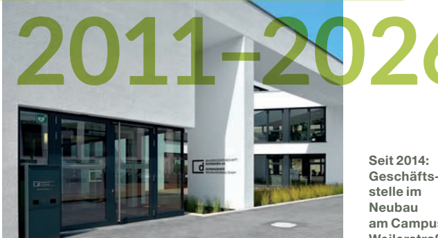
Seit 2014: Geschäftsstelle im Neubau am Campus Weilerstraße

Gegenwart und Zukunft Tradition weiter gedacht. Neue Wege für gutes Wohnen.