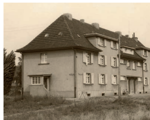
Jussenhovener Straße 77–83, erbaut 1929