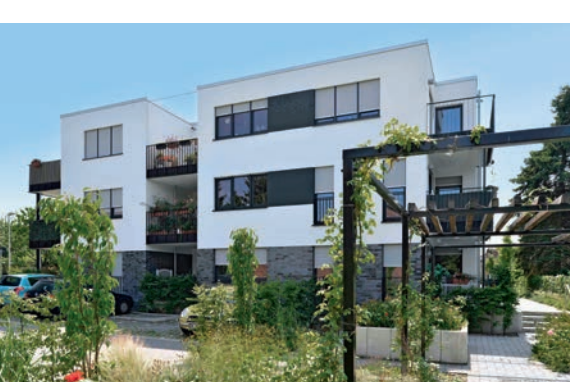
27 barrierefreie Wohnungen in der Schulstraße 49 in Stürzelberg wurden im August 2013 bezugsfertig. Lage und Ausstattung machten die Wohnungen besonders für Senioren interessant.