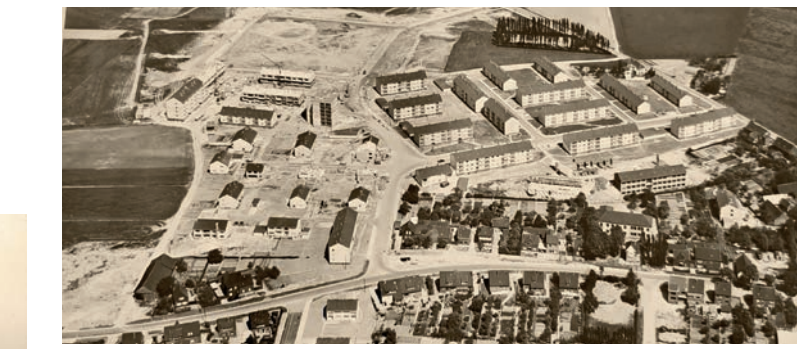
Oben: Die Erschließung des Baufeldes Kastanienweg und Am Hagedorn hat begonnen (1962). Unten: die ersten Rohbauten stehen (1963).