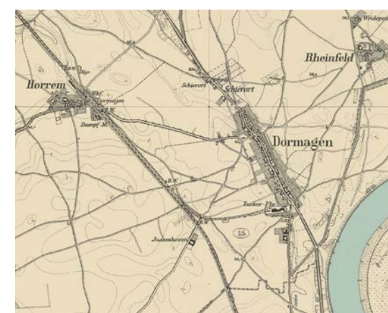
Karte: Copyright © Österreichische Staatsarchiv – Alle Rechte vorbehalten.

Dormagen im 19. Jh.: Trotz Bahnstrecke und Zuckerfabrik (ab 1864) prägten weiterhin dörfliche Strukturen Dormagen im Gründungsjahr 1926.